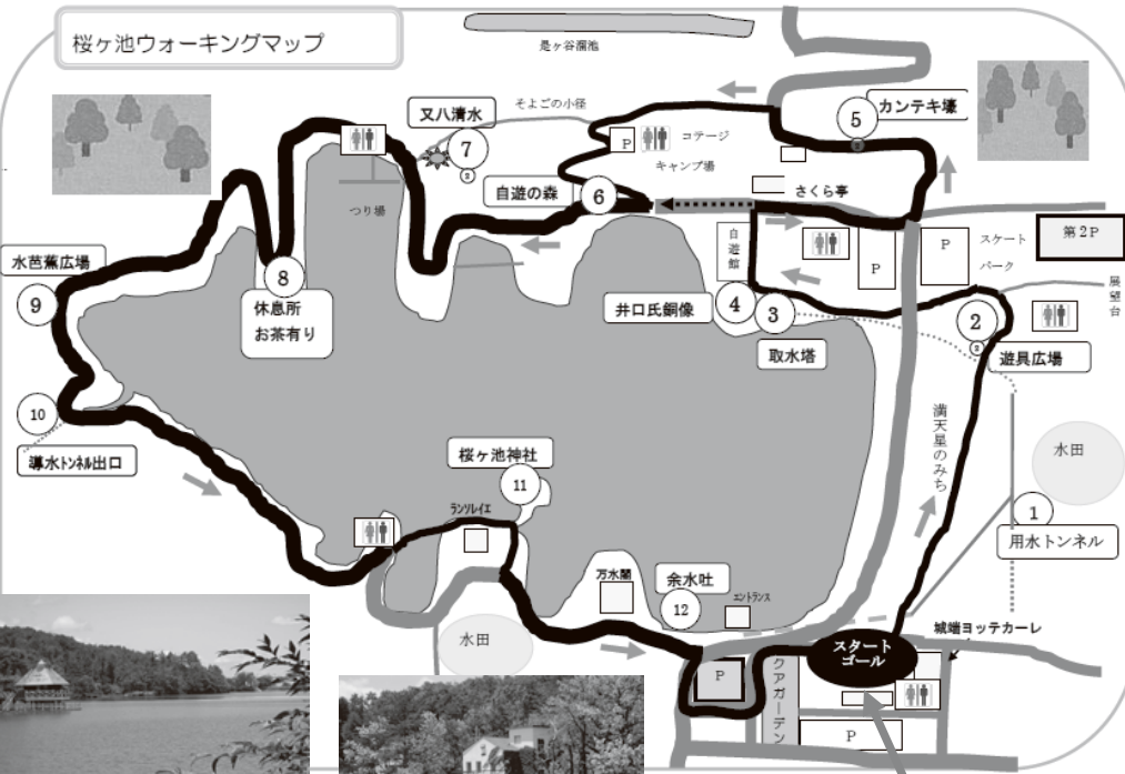
桜ヶ池ウォーキングマップ